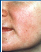
poszerzone naczynia krwionośne